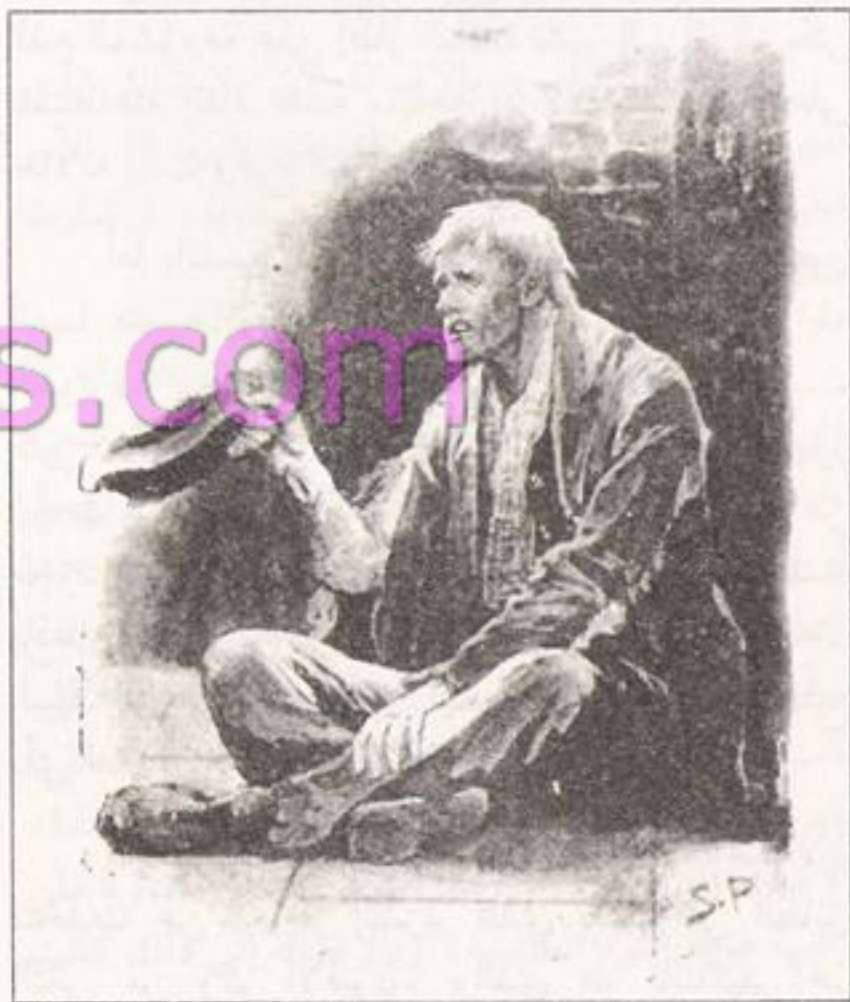
Sydney Paget 1891

اسمه هيو بون، ووجهه القبيح مألوف لدى كل من يذهب كثيراً إلى المدينة، فهو متسول محترف، وإن كان يدعي القيام ببيع الثقاب حتى يتجنب أنظمة الشرطة. فعلى بُعد مسافة قصيرة أسفل شارع ثريدنيدل وعلى الجهة اليسرى توجد زاوية صغيرة في الحائط كما قد تكون لاحظت، وهي المكان الذي يقضي