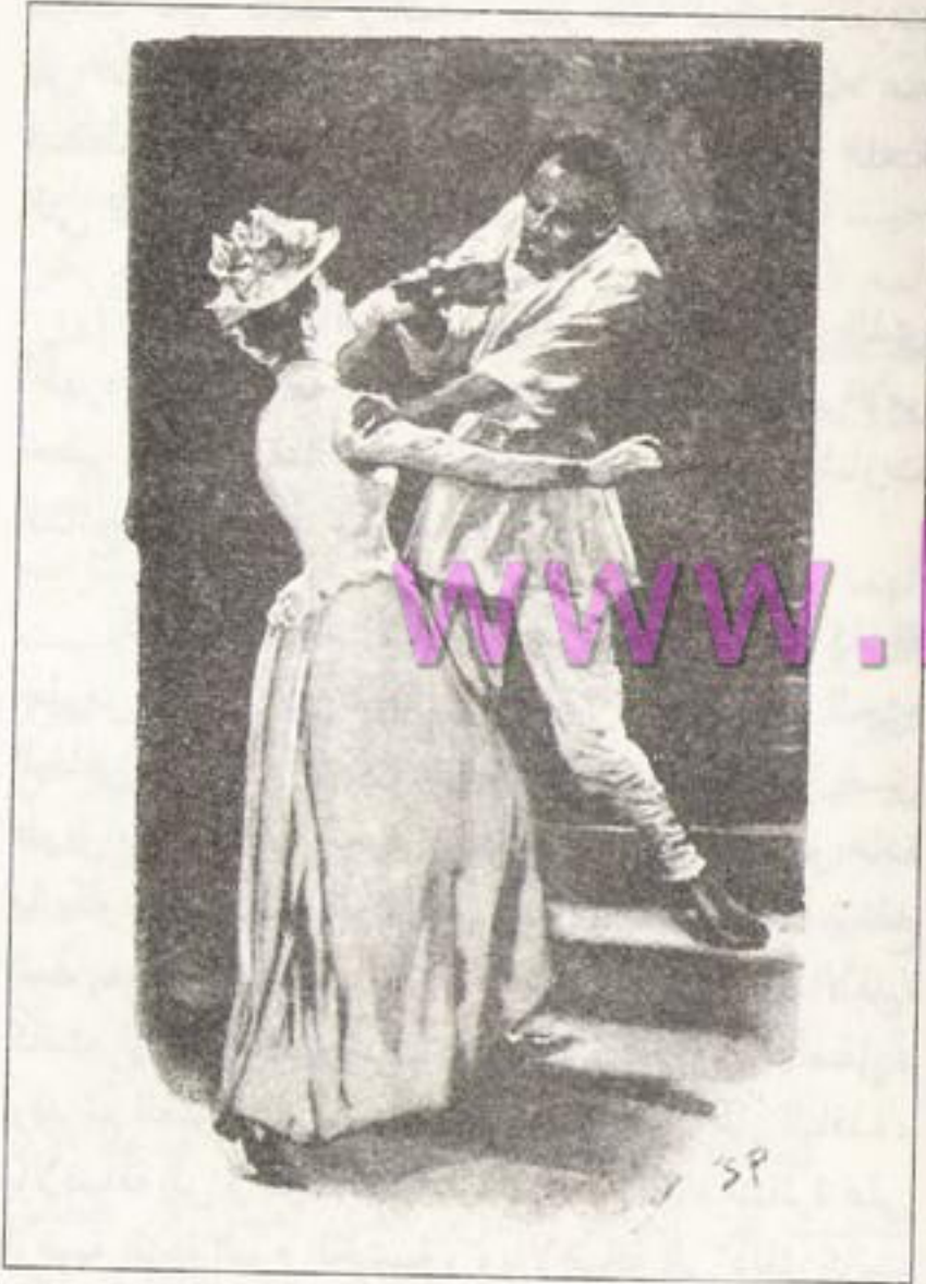
Sydney Paget 1891

لم يكن في الطابق كله إلا شخص عاجز تعس له شكل قبيح يبدو أنه قد اتخذ من ذلك المكان منزلاً له، وقد أقسم هذا الشخص هو والبحار على أنه لم يكن في