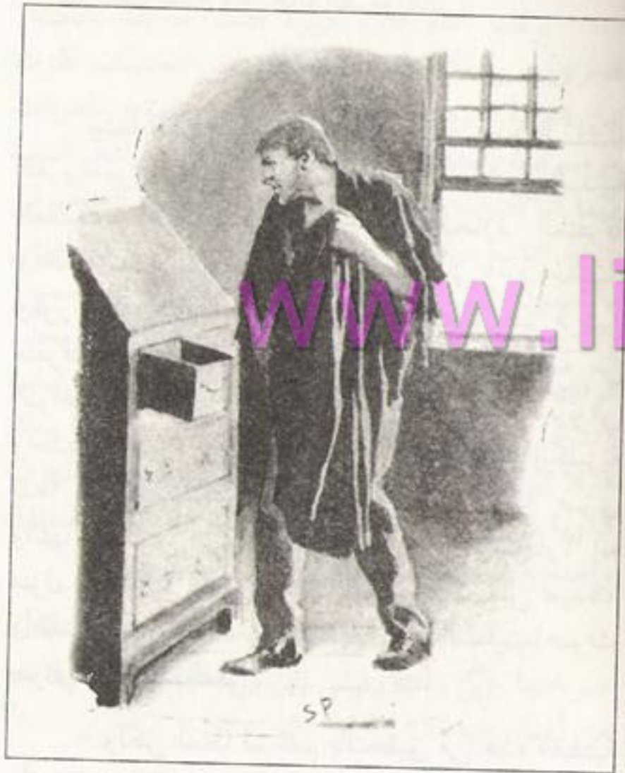
Sydney Paget 1891

ما هو أفضل منها. لقد قبض على بون وتم أخذه إلى قسم الشرطة كما أخبرتك، ولكن لم يظهر أي شيء ضده، فالمعروف عنه منذ سنوات أنه متسول محترف، ولكن يبدو أن حياته كانت هادئة جداً وبطيئة. هذا هو الموقف حالياً، والأسئلة التي يجب حلها هي: ماذا