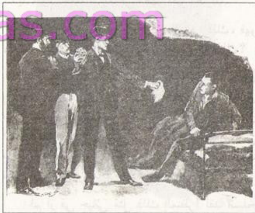
رسم سيدني باجيت ١٨٩١ Sydney Paget 1891

وهكذا فقد بدا الرجل -الذي بدأ يجلس على سريره وهو يدعك عينيه وينظر حوله في ذهول ناعس- شاحباً حزين الوجه ذا مظهر مهذب وشعر أسود بالإضافة إلى بشرة ناعمة! وفجأة أدرك افتضاح أمره فرمى بنفسه على السرير واضعاً وجهه على الوسادة.