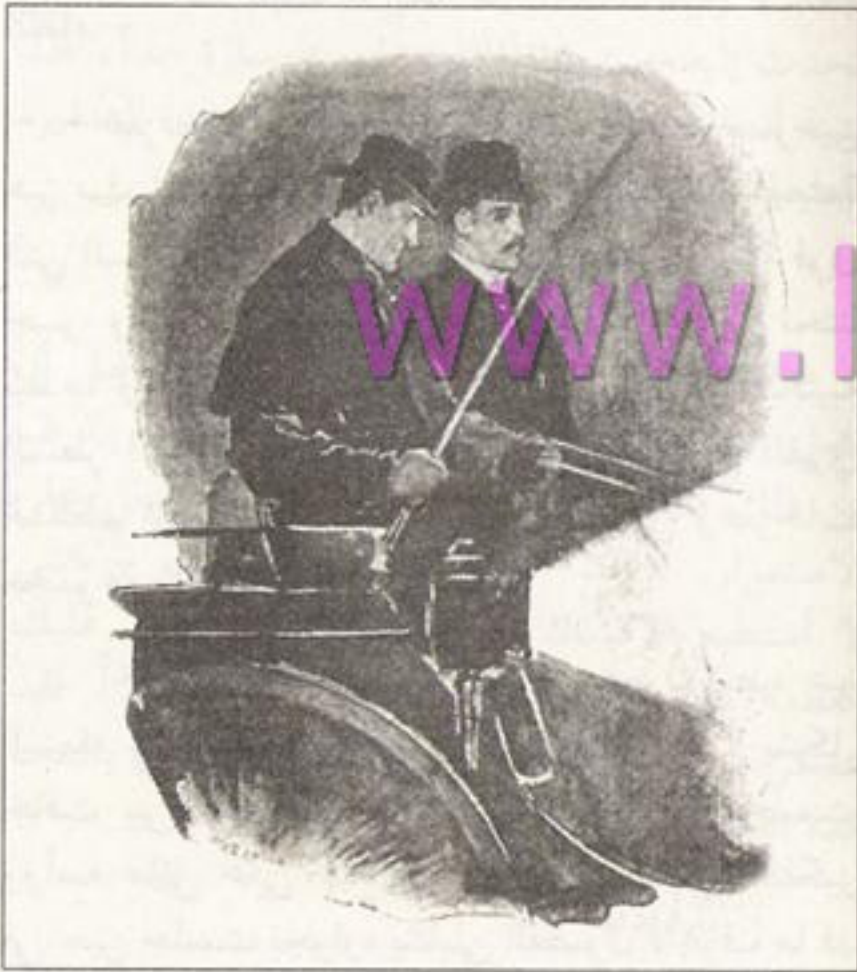
Sydney Paget 1891

- بالقرب من «لي» في «كنت». أمامنا سبعة أميال