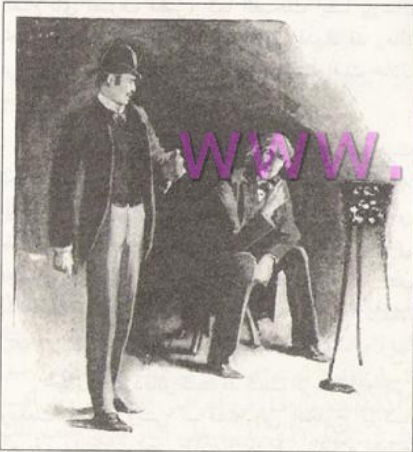
Sydney Paget 1891