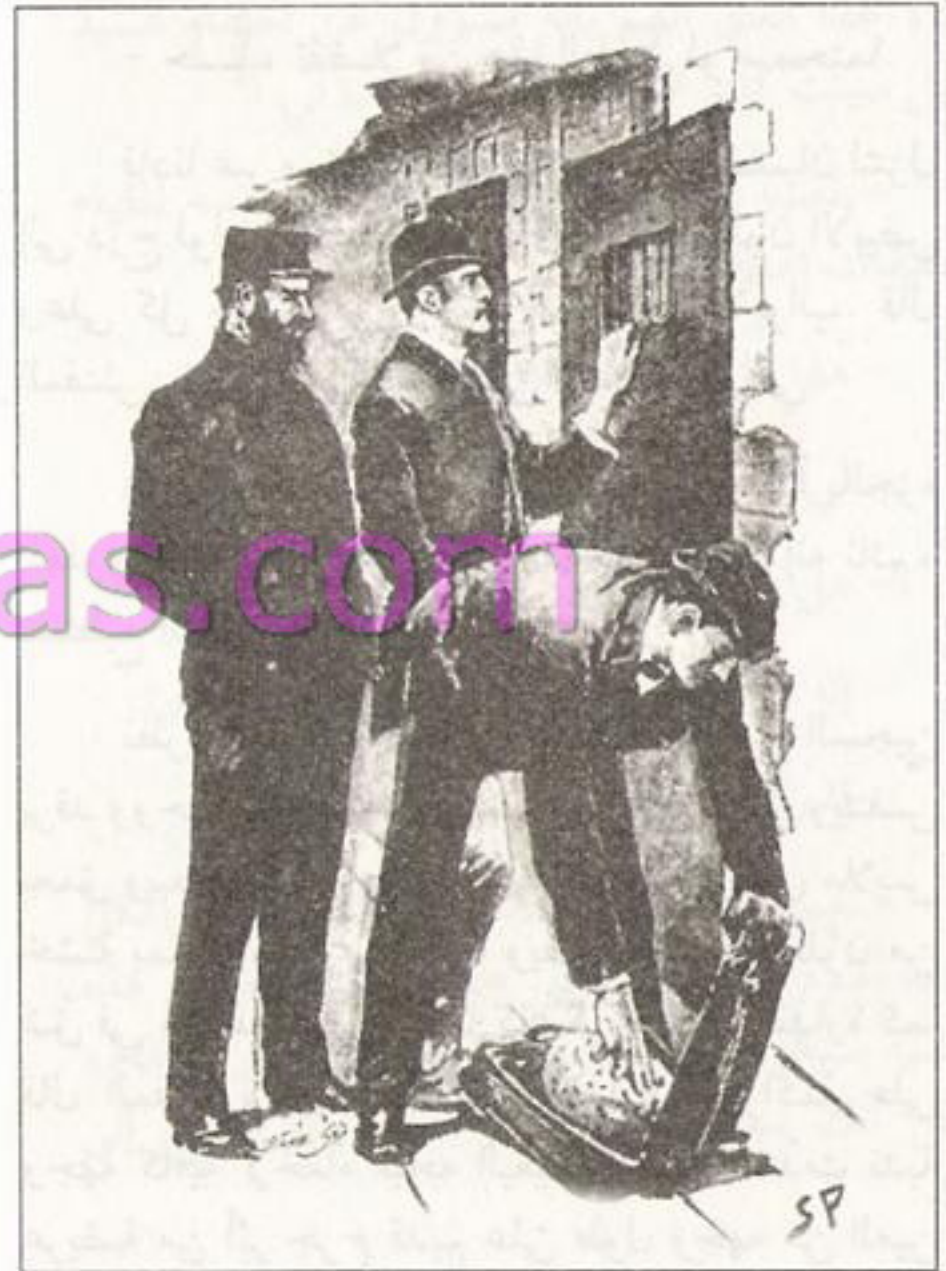
Sydney Paget 1891

العليا فظهرت ثلاثة من أسنانه في تكشيرة دائمة، كما كان الشعر في رأسه وحاجبيه كثيفاً قصيراً وله لون أحمر فاقع.