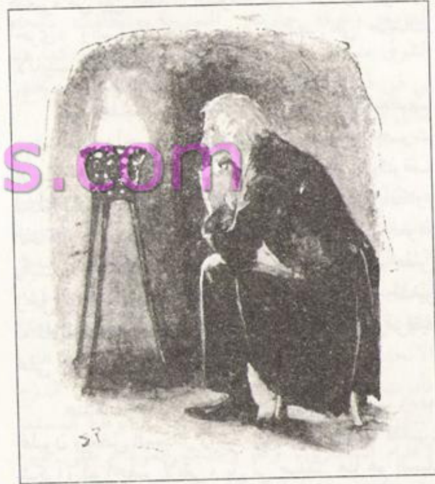
Sydney Paget 1891

كان في حالة مشيرة للشفقة بسبب تأثير المخدر، حيث كان يرتعش بشدة، ثم سألني: كم الساعة الآن يا واطسون؟