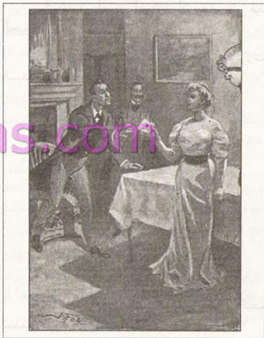
Josef Friedrich 1906

وقفت تبسم وهي ترفع في الهواء قطعة من الورق فقال: هل يمكن أن أراه؟ - بالتأكيد.