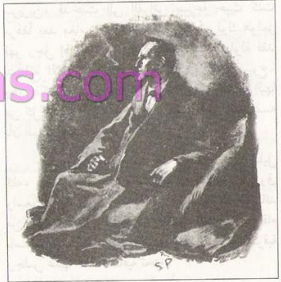
Sydney Paget 1891

بصمت وبلا حركة وبين شفّته غليون قديم من جذر الورد وعيناه مثبتتان بلا تعبير على زاوية السقف، وكان الدخان الأزرق يتصاعد في دوائر من فمه والضوء يلمع على ملامح وجهه القوية التي تشبه ملامح النسرين. كان يجلس بهذا الشكل عندما استسلمت للنوم... وهكذا وجدته حين أيقظتني صرخة مفاجئة لأجد شمس الصيف تضيء الغرفة وأجد أن الغليون لا يزال بين شفّته!