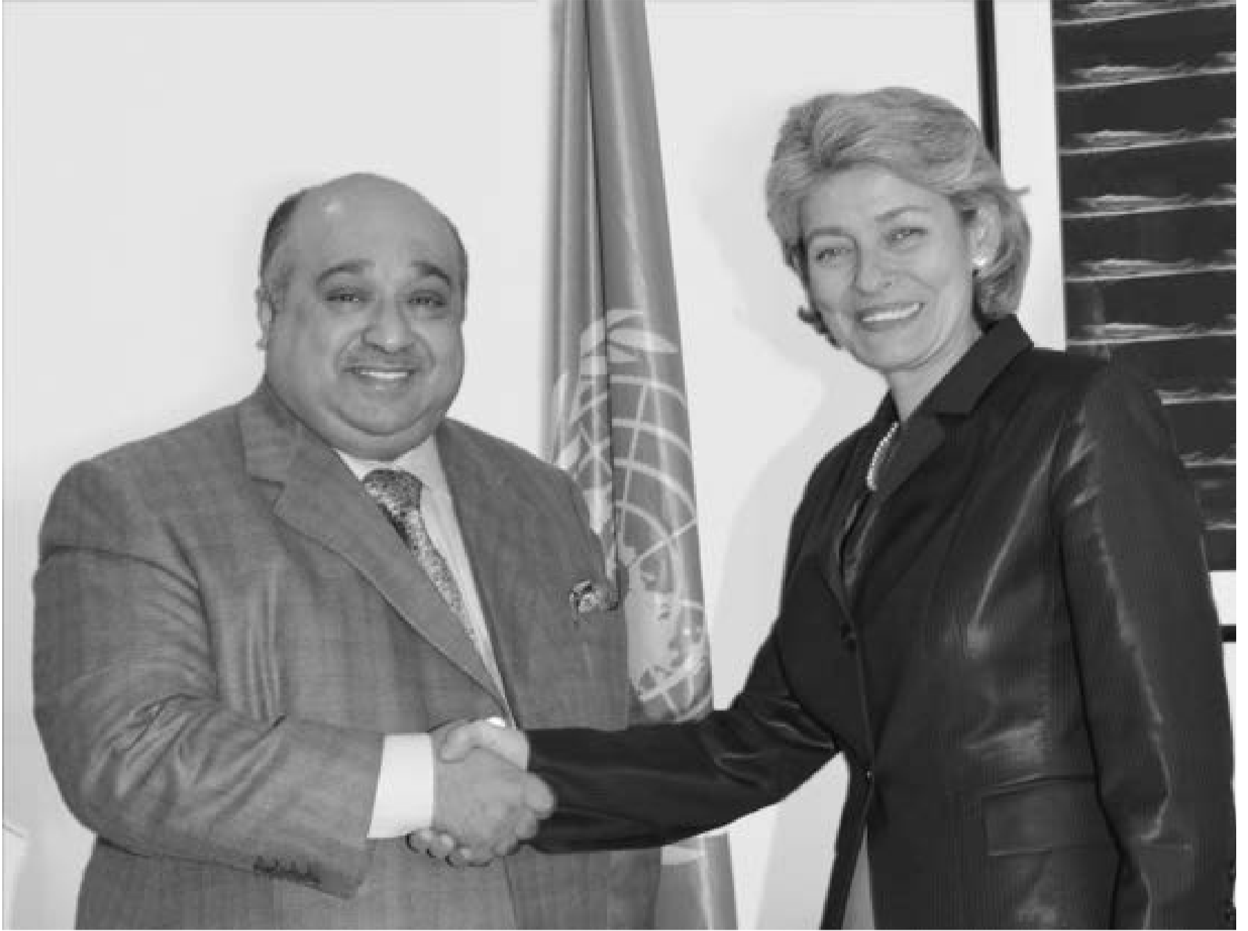
معالي السيدة إيرينا بوكوفا Irina Bokova، المديرية العامة لمنظمة الأمم المتحدة للتربية والعلم والثقافة - اليونسكو - ومعالي الشيخ محمد بن عيسى الجابر MBI Al Jaber المبعوث الخاص لمنظمة اليونسكو للتسامح والديمقراطية والسلام.

إيماناً منها بأهمية نشر المعرفة وتشجيع القراءة ودعم الفن التشكيلي لمواجهة الأزمة الثقافية الخانقة في العالم العربي، وإسهاماً في إعداد جيل عصريّ عربي قادر على المساهمة في بناء الحضارة الحديثة والتوصل عبر التربية والعلم والثقافة إلى إدراك الديمقراطية والسلام تمثيلاً مع مبادئ الميثاق التأسيسي لليونسكو، تُصدرُ مؤسسة محمد بن عيسى الجابر MBI Al Jaber Foundation بالتعاون مع منظمة اليونسكو / UNESCO وبالإشتراك مع كبريات الصحف اليومية العربية تؤازرها نخبة من كبار الأدباء والكتاب ومن ورائهم الملايين من القارئ،